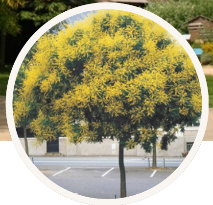
Tolère bien la chaleur