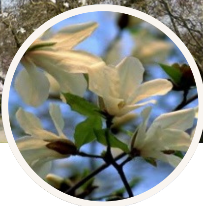
Bonne tolérance au calcaire